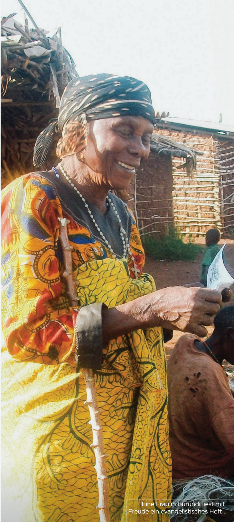
Eine Frau in Burundi liest mit Freude ein evangelistisches Heft.

Internationaler Präsident Dick Eastman Nationaler Direktor Beat Baumann Redaktion Reinhold Scharnowski Design Oliver Häberlin, Drew Emmert